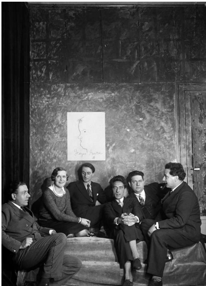
Le Groupe des Six © Boris Lipnitski / Roger-Viollet, 1931

Au cœur de la Maison, l'exposition temporaire « Prenez garde à la musique. Les univers musicaux de Jean Cocteau » invitera à une traversée du XX e siècle en musique et à une découverte des univers musicaux de Jean Cocteau. L'exposition fera entendre et voir les compositions musicales et les musiciens, qui ont accompagné l'artiste à chaque étape de sa vie.